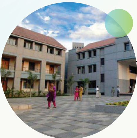
SRI KRISHNA ARTS & SCIENCE COLLEGE