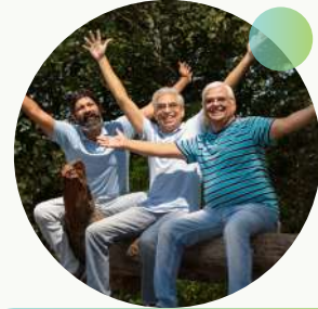
SENIOR CITIZEN THEMED